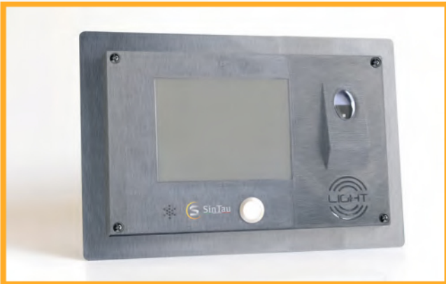
JANUS Voice and Video VoIP Intercom System