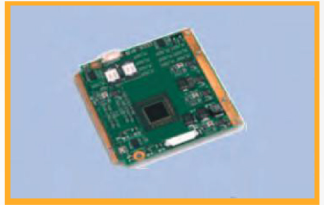
A370_Q7_COM Armada370 Networking Computer On Module